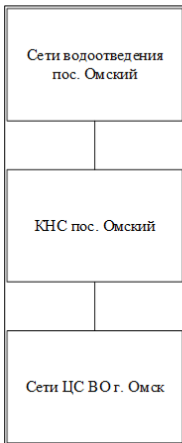
Рисунок 2.1.1 – Структурная схема централизованного водоотведения СП Омское

Структурная схема централизованного водоотведения СП Омское приведена на рисунке 2.1.1.