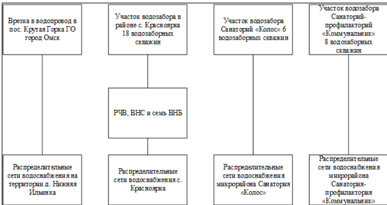
Рисунок 1.1.1 – Структурная схема централизованного водоснабжения СП Красноярское

В СП Красноярское централизованная система водоснабжения с объединённым хозяйственно-питьевым и противопожарным водопроводом. Данный водопровод относится к категории надёжности II, где допускается снижение подачи воды на хозяйственно-питьевые нужды не более чем на 30 % от расчётного расхода и на производственные нужды до предела установленного аварийным графиком работы предприятия. Длительность снижения подачи не должна превышать трое суток.