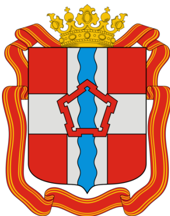
СХЕМА ВОДОСНАБЖЕНИЯ И ВОДООТВЕДЕНИЯ ГОРОДСКОГО ПОСЕЛЕНИЯ ЧЕРНОЛУЧИНСКОЕ ОМСКОГО МУНИЦИПАЛЬНОГО РАЙОНА ОМСКОЙ ОБЛАСТИ