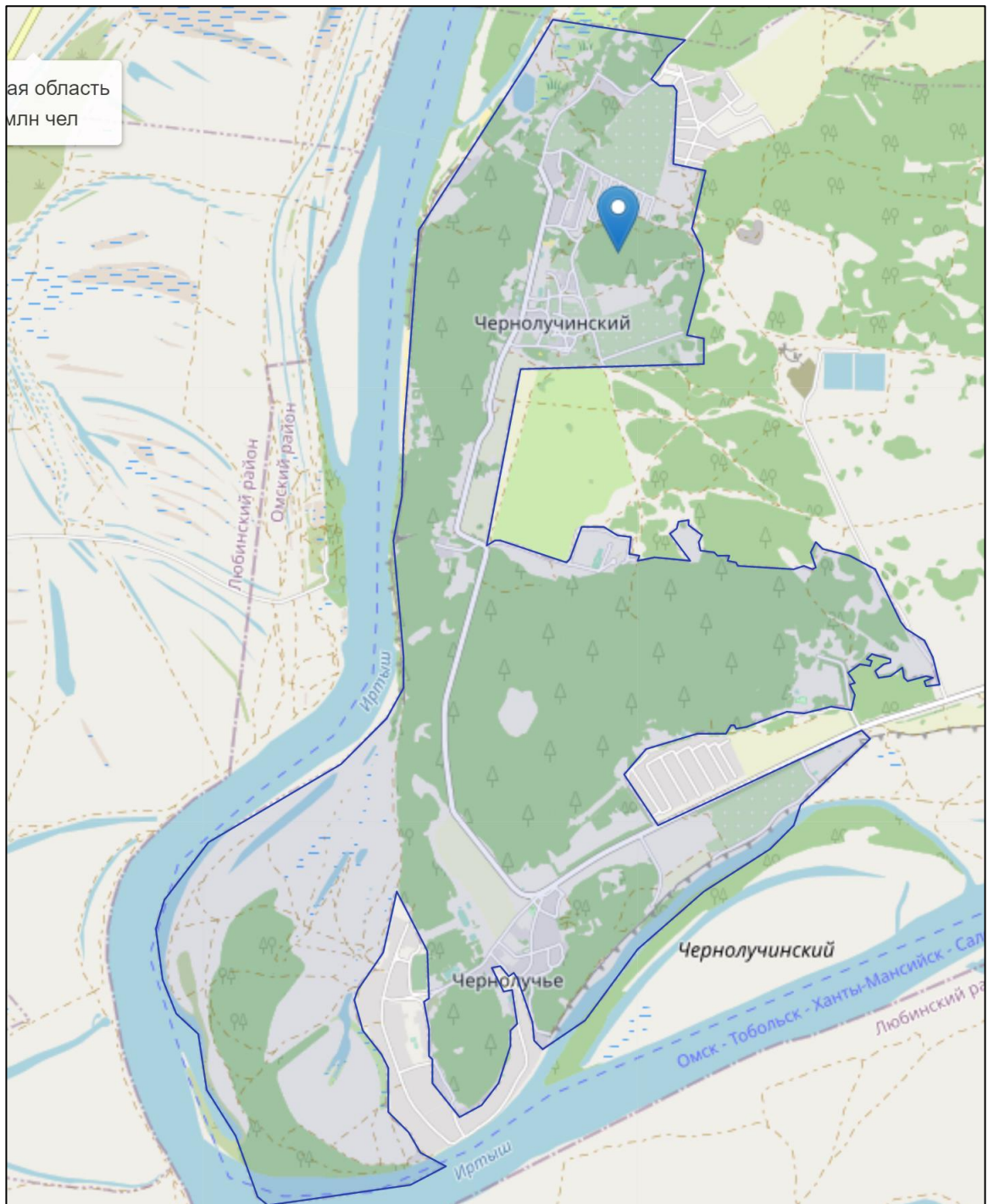
Рисунок 1 – Картосхема административных границ ГП Чернолучинское