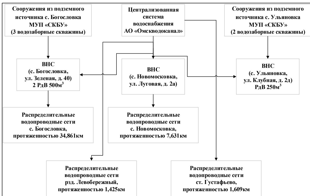
Рисунок 1.1.1 – Структурная схема централизованного водоснабжения СП Богословское

Структурная схема централизованного водоснабжения СП Богословское приведена на рисунке 1.1.1.